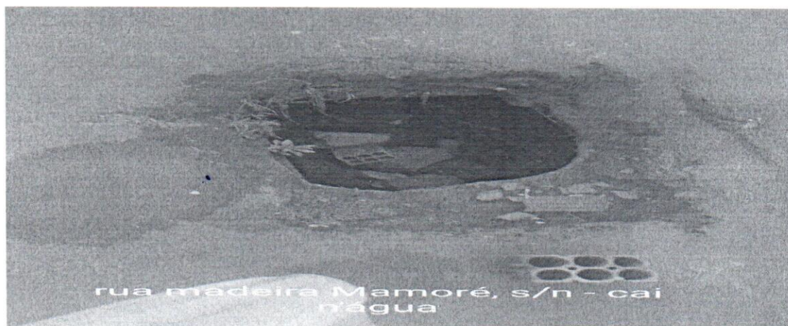
rua madeira Mamoré, s/n - cai n'agua

Nossa equipe foi até o local e comprovou que o pedido solicitado requer urgência, pois há muito tempo a rua não têm recebido nenhuma manutenção da prefeitura e sentem falta de um bairro mais cuidado e limpo.