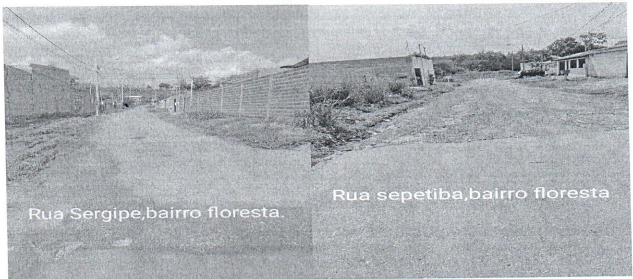
Rua Sergipe, bairro floresta.

O trânsito de veículos é outro problema que os moradores e população em geral enfrentam todos os dias, quando precisam sair para trabalhar, estudar e desenvolver qualquer outra atividade que faça parte do seu cotidiano.