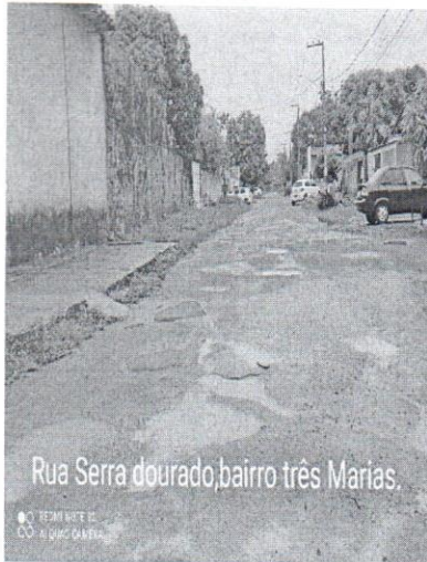
Rua Serra dourado, bairro três Marias.