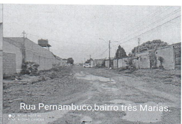
Rua Pernambuco, bairro três Marias.