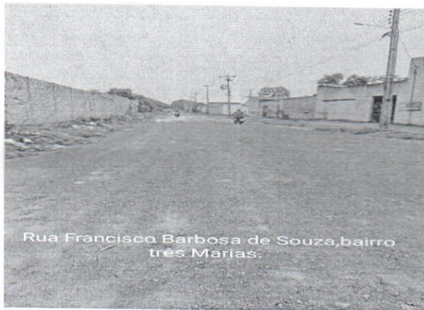
Rua Francisco Barbosa de Souza, bairro três Marias.