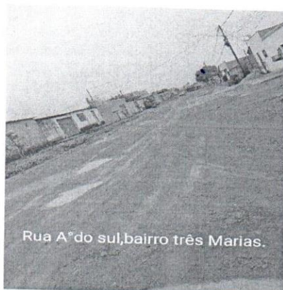
Rua A°do sul, bairro três Marias.

O trânsito de veículos é outro problema que os moradores e população em geral enfrentam todos os dias, quando precisam sair para trabalhar, estudar e desenvolver qualquer outra atividade que faça parte do seu cotidiano.