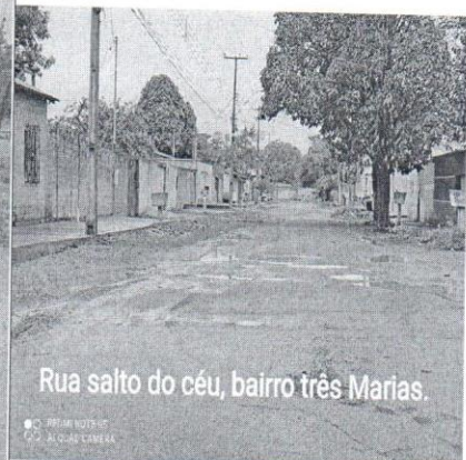
Rua salto do céu, bairro três Marias.