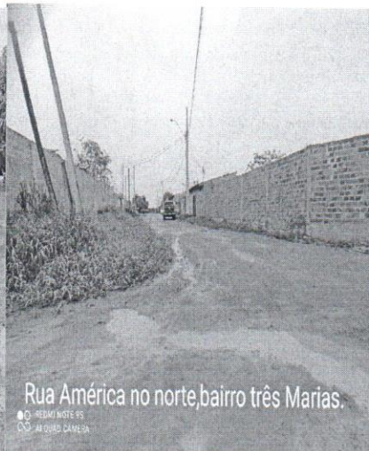
Rua América no norte, bairro três Marias.