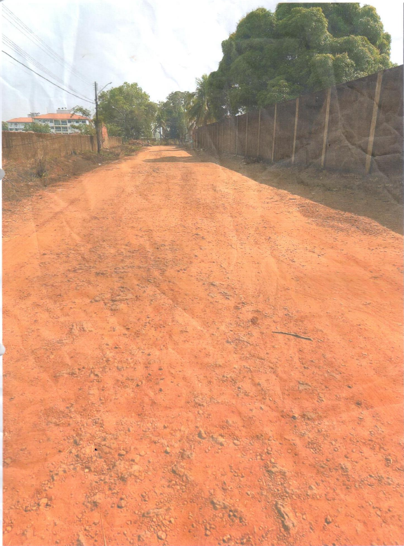
RUA ALTO MADEIRA BAIRRO : INDUSTRIAL