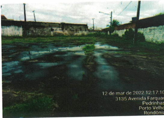
12 de mar de 2022 12:17:10 3135 Avenida Farquar Pedrinhas Porto Velho Rondônia