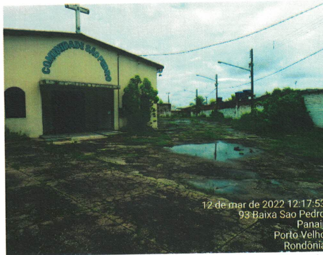
12 de mar de 2022 12:17:53 93 Baixa Sao Pedro Panair Porto Velho Rondônia