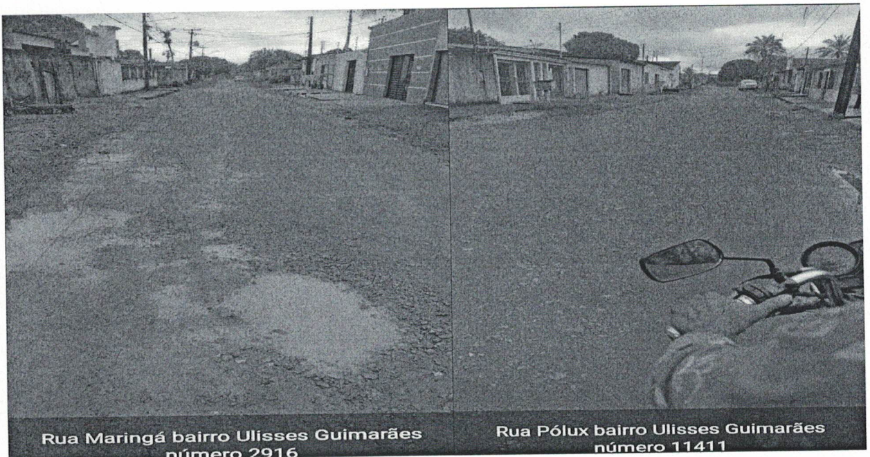
Rua Maringá bairro Ulisses Guimarães número 2916

O trânsito de veículos é outro problema que os moradores e população em geral enfrentam todos os dias, quando precisam sair para trabalhar, estudar e desenvolver qualquer outra atividade que faça parte do seu cotidiano, tudo isso tem gerado um grande transtorno em suas vidas.