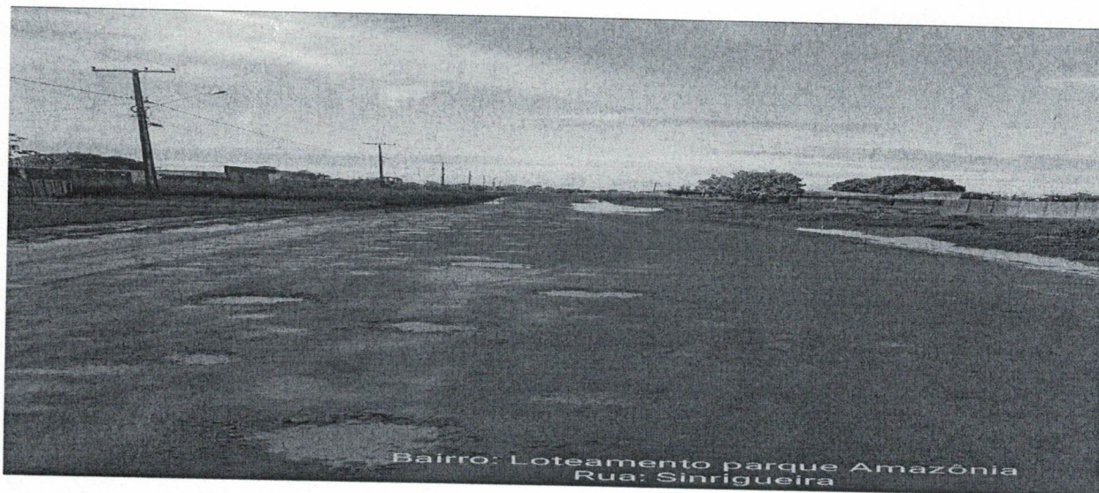
Bairro: Loteamento Parque Amazônia Rua: Seringueira

O trânsito de veículos é outro problema que os moradores e população em geral enfrentam todos os dias, quando precisam sair para trabalhar, estudar e desenvolver qualquer outra atividade que faça parte do seu cotidiano, tudo isso tem gerado um grande transtorno em suas vidas.