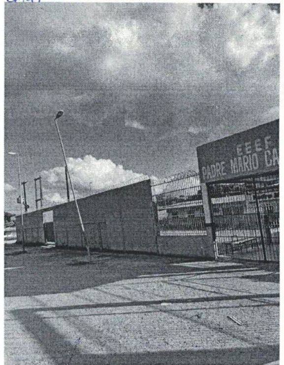
Sala das Sessões, 08 de julho de 2022.

Portanto, aguardamos que medidas e providências sejam tomadas mais breve possível, afim que, seja evitado ou amenizado tal situação.