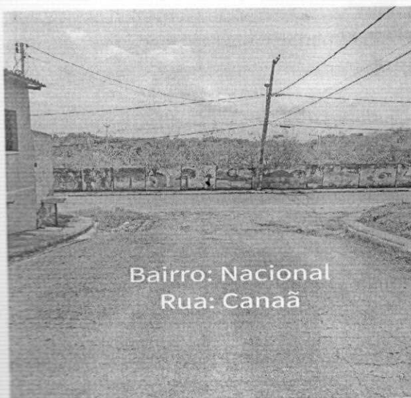
Bairro: Nacional Rua: Canaã

O trânsito de veículos é outro problema que os moradores e população em geral enfrentam todos os dias, quando precisam sair para trabalhar, estudar e desenvolver qualquer outra atividade que faça parte do seu cotidiano.