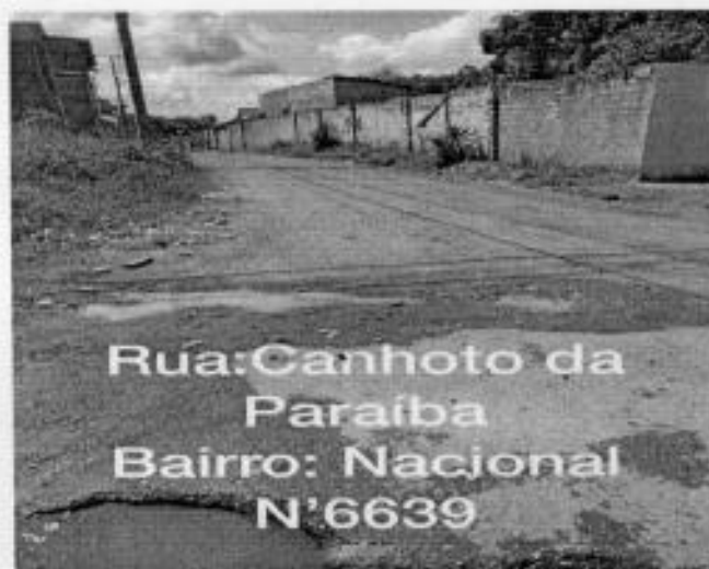
Rua:Canhoto da Paraíba Bairro: Nacional N'6639

O trânsito de veículos é outro problema que os moradores e população em geral enfrentam todos os dias, quando precisam sair para trabalhar, estudar e desenvolver qualquer outra atividade que faça parte do seu cotidiano.