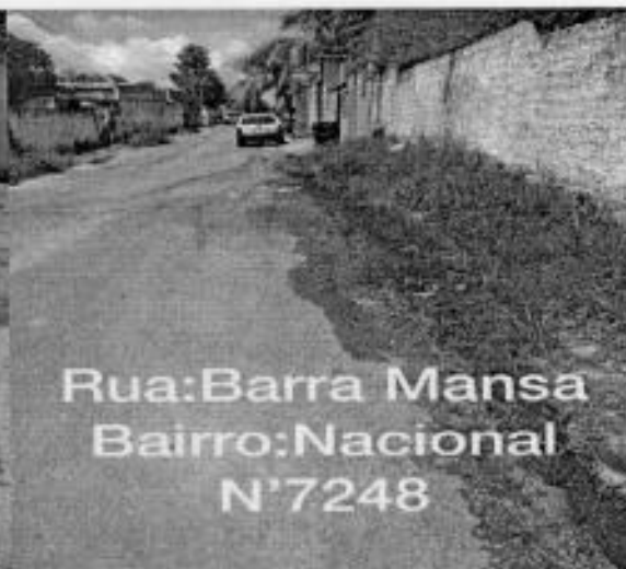
Rua:Barra Mansa Bairro:Nacional N'7248