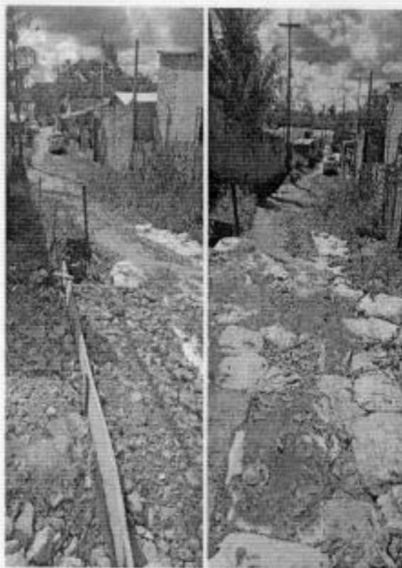
Sala das Sessões, 02 de fevereiro de 2023.

Portanto, aguardamos que medidas e providências sejam tomadas o mais breve possível, a fim de que, seja evitada ou amenizada tal situação.