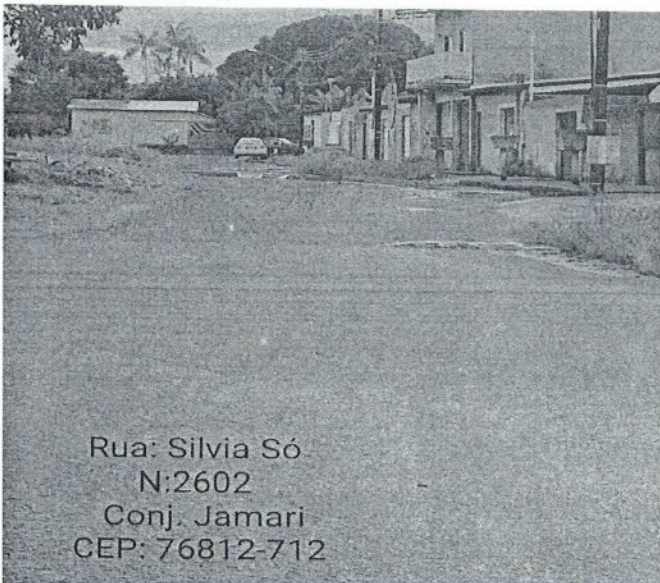
Rua: Silvia Só N:2602 Conj. Jamari CEP: 76812-712

O trânsito de veículos é outro problema que os moradores e população em geral enfrentam todos os dias, quando precisam sair para trabalhar, estudar e desenvolver qualquer outra atividade que faça parte do seu cotidiano.