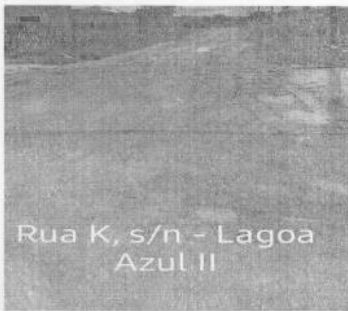
Rua K, s/n - Lagoa Azul II