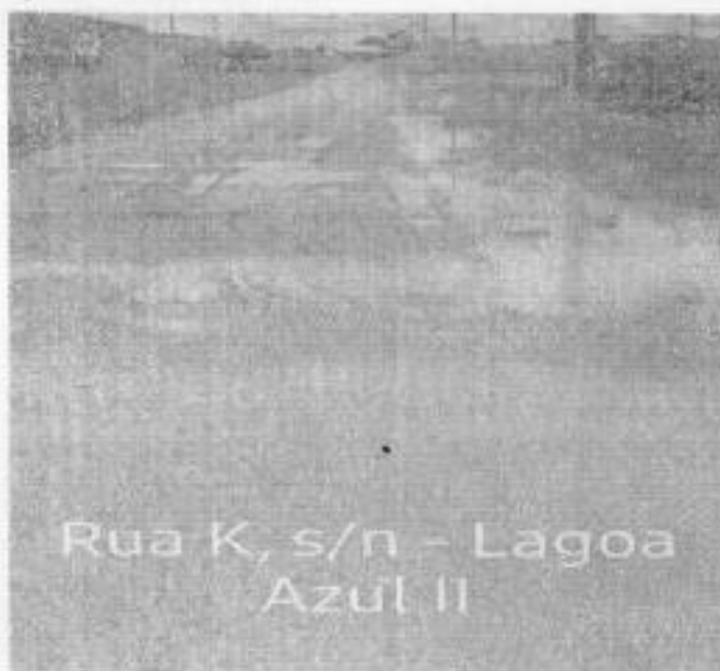
Rua K, s/n - Lagoa Azul II

O trânsito de veículos é outro problema que os moradores e população em geral enfrentam todos os dias, quando precisam sair para trabalhar, estudar e desenvolver qualquer outra atividade que faça parte do seu cotidiano.