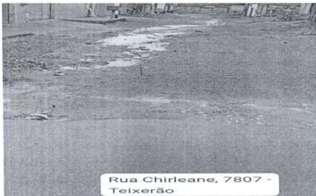
Rua Chirleane, 7807 - Teixeira

Preocupados com essa situação procuraram a equipe deste gabinete solicitando providências junto a prefeitura de Porto Velho no sentido de viabilizar a limpeza e manutenção da área citada com urgência, uma vez que o problema já se arrasta por muito tempo sem que nenhuma manutenção fosse feita no local. (Foto Anexa.)