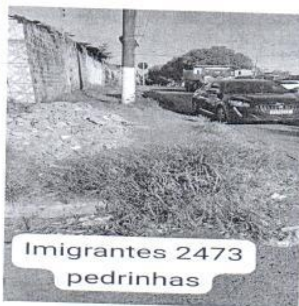
Imigrantes 2473 pedrinhas