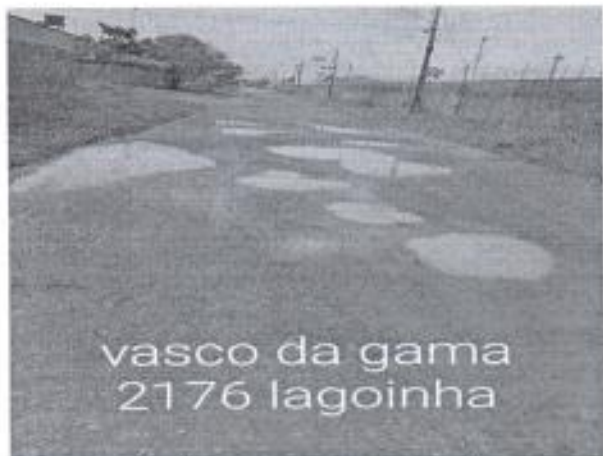
vasco da gama 2176 lagoinha