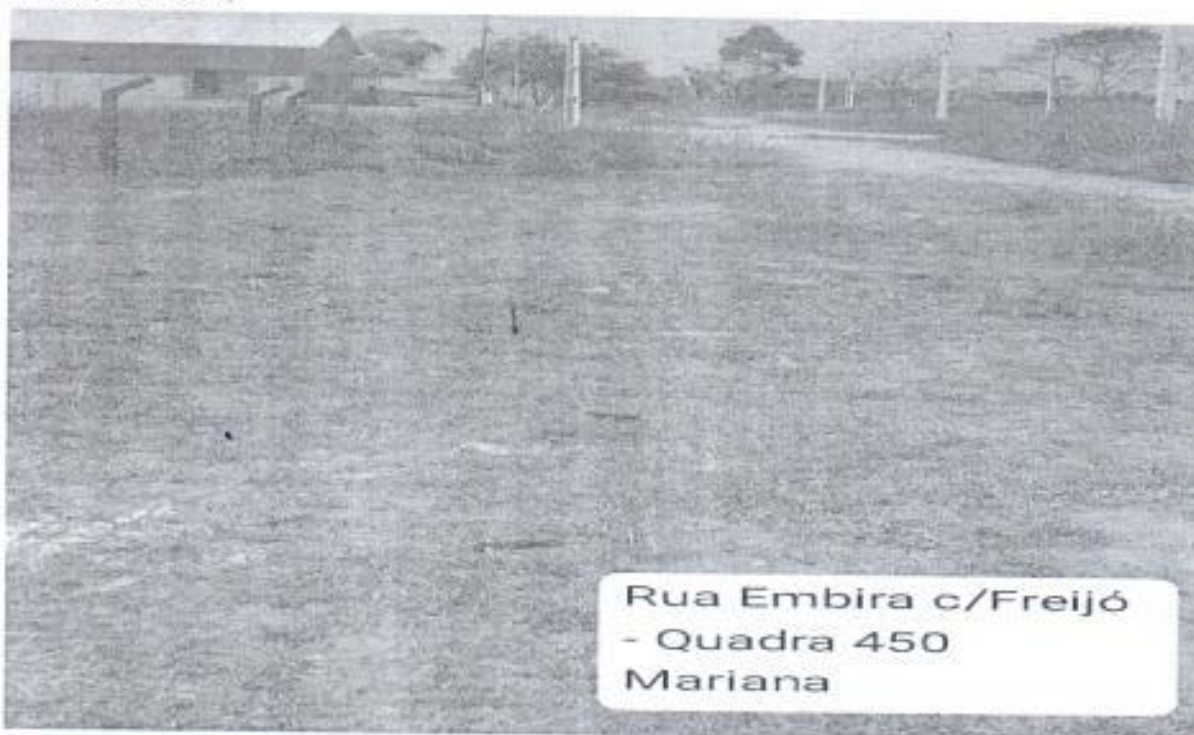
Rua Embira c/Freijó - Quadra 450 Mariana

Preocupados com essa situação procuraram a equipe deste gabinete solicitando providências junto a prefeitura de Porto Velho no sentido de viabilizar a limpeza e manutenção da área citada com urgência, uma vez que o problema já se arrasta por muito tempo sem que nenhuma manutenção fosse feita no local. (Foto Anexa.)